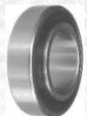
CLAVE: B88517 NO. PARTE: 88-510 BALERO EUROFAG