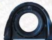
CLAVE: S05124 NO. PARTE: BC-512 SOPORTE DE BARRA DE CARDAN LODI