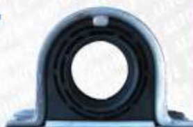
CLAVE: S01075 NO. PARTE: BC-107 SOPORTE DE BARRA DE CARDAN LODI