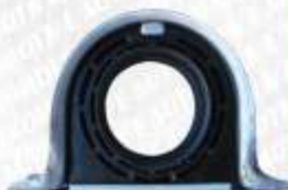
CLAVE: S05108 NO. PARTE: BC-510 SOPORTE DE BARRA DE CARDAN LODI