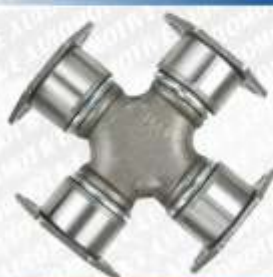
CLAVE: C18067 NO. PARTE: 1806

CRUCETA DINA 631G 68-85-DINA F-2574, F2575 (79..), DINA 861K1, 861K1 2.5, D6510J, D-6512J 77-80 ,DODGE 1700 56-66 KENWORTH CHASIS CAB Q551103 91-92, TRACTO CAMION 85-86, T-800 HD 88-89, K-524 89, W-9244 89..., T-450 92-92, W-900B, Tracto, T-800, C-500B, 90-92, M-Benz Tracto camión 82-85, F-2574/ F-2575 82-85, SF-2574, SF-2575 86-88, L-1517/5250, L-1521/5250 90-92, Tracto Freightliner 90-92, MARK, NAVISTAR VOLVO 577-11, MASA M-200, 5-1500, 5-2030, 5-7000 77-81, 5-L030, Autobus 5000 80-81, Trolebus 80-81, 5-1500, 51502 5 Vel 82..., 5-500B, 5-500T aut. 82-84, 74-8114 SPICER 5-280X GMB 230-0280 334 AUTOPAR A-280X 5-0280