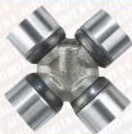
CLAVE: C85068 NO. PARTE: 1023

CRUCETA FORD BRONCO 80-96; E-100 ECONOLINE 79-83; E-150 ECONOLINE 79-88; E-250 ECONOLINE 79-96; F-100 79-83; F-150 80-96; F-250 79-94; F-350 79-94; LTD 65; LTD 77-79; MUSTANG 70-73; RANCHERO 75-77; COUGAR 67-70. APLICACION MARINA HONDA BF-115 4STROKE; BF-130 4STROKE; BF-135 4STROKE; BF-150 4STROKE; BF-200 4STROKE; BF-225 4STROKE. 434 74-8501 2-4900 G5-1204X 5-1204X