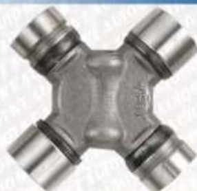
CLAVE: C85013 NO. PARTE: 1013

CRUCETA FORD BRONCO 80-96; E-100 ECONOLINE 79-83; E-150 ECONOLINE 79-88; E-250 ECONOLINE 79-96; F-100 79-83; F-150 80-96; F-250 79-94; F-350 79-94; LTD 65; LTD 77-79; MUSTANG 70-73; RANCHERO 75-77; COUGAR 67-70. APLICACION MARINA HONDA BF-115 4STROKE; BF-130 4STROKE; BF-135 4STROKE; BF-150 4STROKE; BF-200 4STROKE; BF-225 4STROKE. 434 74-8501 2-4900 G5-1204X 5-1204X