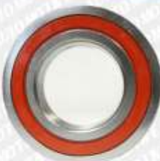
CLAVE: B05089 NO. PARTE: 88-508 BALERO EUROFAG