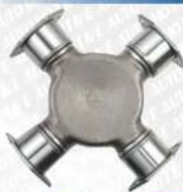
CLAVE: C81126 NO. PARTE: 1810

CRUCETA DINA D6710J 85-87, Mercedes Benz SERIES L1417/52, L1417/34 89-97, L1521/70B, L1521/52 89..., Masa Autobus V92 94-96, Famsa L2121/54 redilas, OH, DM91 89-96, Famsa 1217, 1417 92-98, 333 74-8516 SPICER 5-279X AUTOPAR A-279X SERIE 1610 RAIMSA 516-11 4-0058