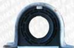
CLAVE: S05093 NO. PARTE: BC-509 SOPORTE DE BARRA DE CARDAN LODI