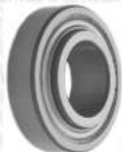
CLAVE: B81076 NO. PARTE: 88-107 BALERO EUROFAG