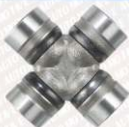
CLAVE: C57103 NO. PARTE: 1057

CRUCETA ALFA ROMEO 54-94, AM 81, AUSTIN 57-77, AUSTIN HEALY 58-75, CAMIONETAS CHEV LUV 71-82, FORD INGLES 53-73, FIAT 74-85, FLEXIBLE 56-89, HILLMAN 45-77, CAMIONETAS ISUZU 81-95, CAMIONETAS JEEP 41-93, LOTUS 62-77, MARCK 37-96, METROPOLITAN 54-76, MG 45-76, PASAJEROS NISSAN 65, PASAJEROS PLYMOUTH 71-74, RELIANT 54-70 SERIES 1210 341 74-8506 SPICER 5-105X GU-500 1-0300