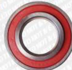
CLAVE: B94080 NO. PARTE: 88-509 BALERO EUROFAG