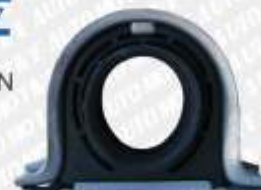
CLAVE: S05080 NO. PARTE: BC-508 SOPORTE DE BARRA DE CARDAN LODI