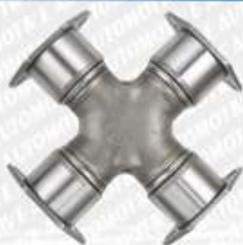
CLAVE: C18025 NO. PARTE: 1802

CRUCETA DINA 631G 68-85-DINA F-2574, F2575 (79..), DINA 861K1, 861K1 2.5, D6510J, D-6512J 77-80 ,DODGE 1700 56-66 KENWORTH CHASIS CAB Q551103 91-92, TRACTO CAMION 85-86, T-800 HD 88-89, K-524 89, W-9244 89..., T-450 92-92, W-900B, Tracto, T-800, C-500B, 90-92, M-Benz Tracto camión 82-85, F-2574/ F-2575 82-85, SF-2574, SF-2575 86-88, L-1517/5250, L-1521/5250 90-92, Tracto Freightliner 90-92, MARK, NAVISTAR VOLVO 577-11, MASA M-200, 5-1500, 5-2030, 5-7000 77-81, 5-L030, Autobus 5000 80-81, Trolebus 80-81, 5-1500, 51502 5 Vel 82..., 5-500B, 5-500T aut. 82-84, 74-8114 SPICER 5-280X GMB 230-0280 334 AUTOPAR A-280X 5-0280